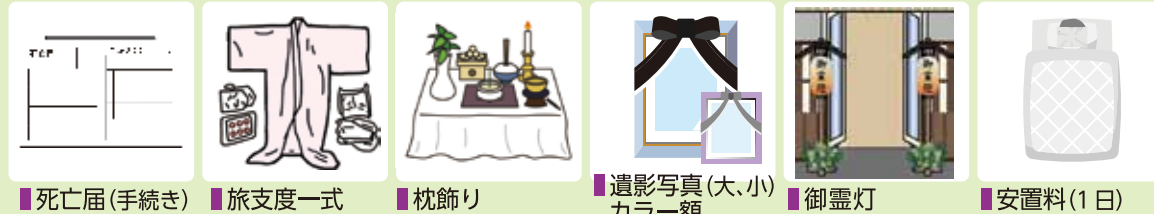
死亡届(手続き) 旅支度一式 枕飾り 遺影写真(大、小) カラー額 御霊灯 安置料(1日)