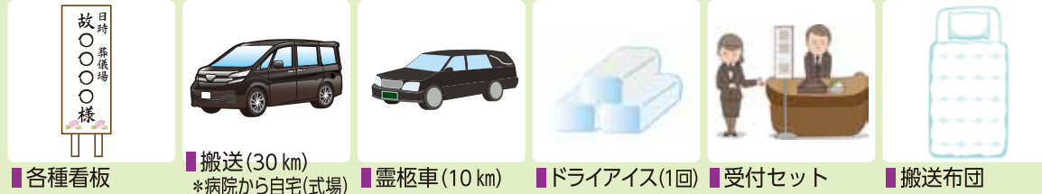
各種看板 搬送(30 km) *病院から自宅(式場) 霊柩車(10 km) ドライアイス(1回) 受付セット 搬送布団