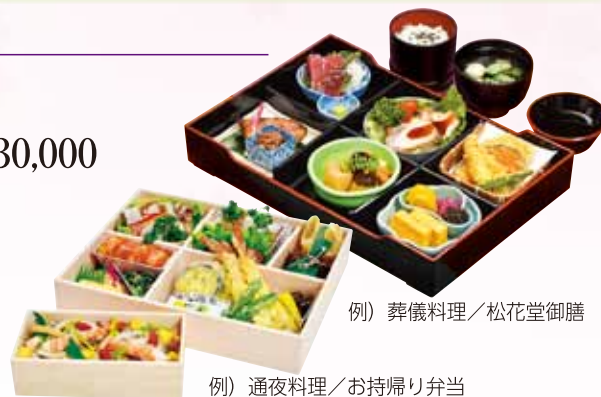
例) 葬儀料理 / 松花堂御膳

合計 ▶ 葬儀費用 ￥330,000 + 別途費用 約 ￥260,000 = 約 ￥590,000