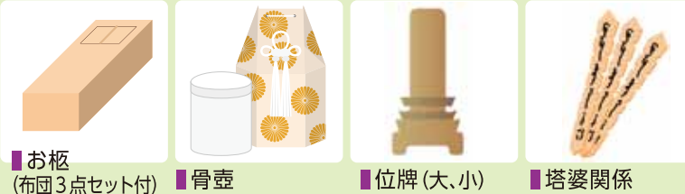
お柩 (布団3点セット付) 骨壺 位牌 (大、小) 塔婆関係