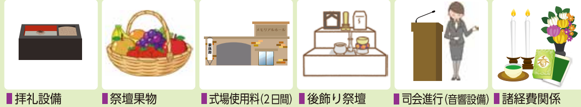
拝礼設備 祭壇果物 式場使用料(2日間) 後飾り祭壇 司会進行(音響設備) 諸経費関係

※返礼品・食事・マイクロバス・湯灌等は別途となります。※他にもプランをご用意しております